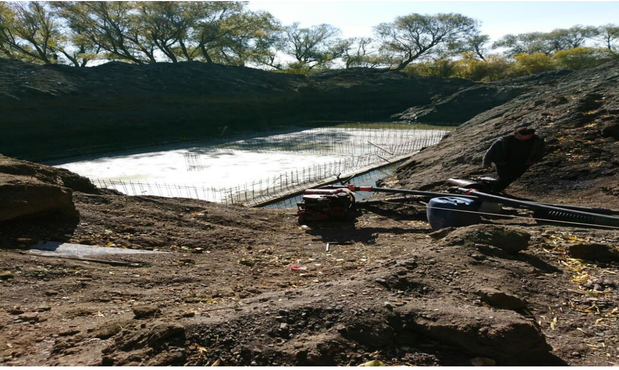
Erdađı ime suyu