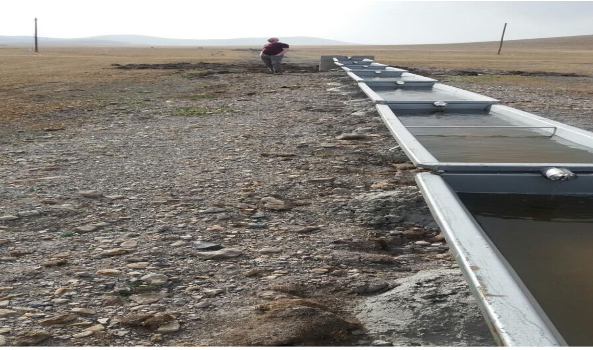
Yanlızçam his sıvat