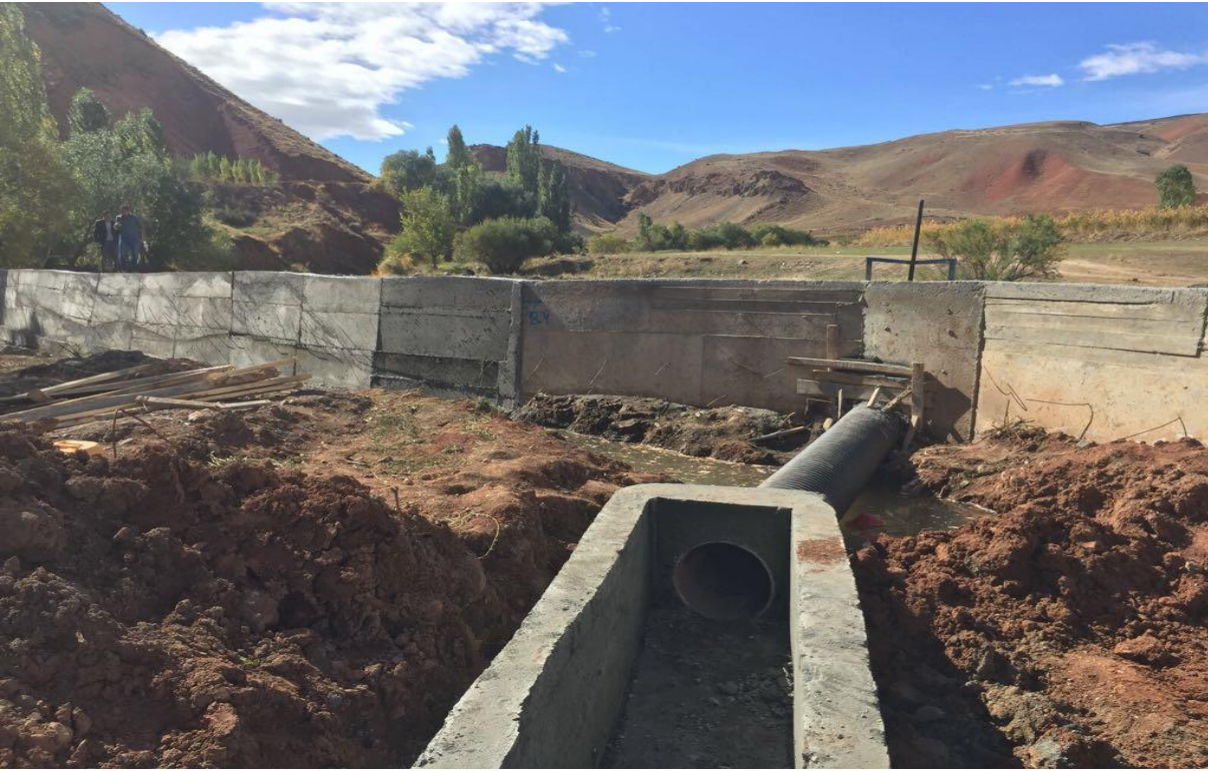
Bölükbaşı hayvan içme suyu sıvat