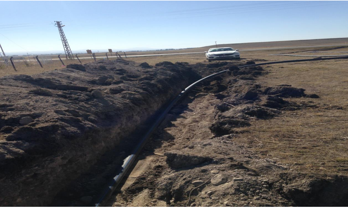
Kağızman bulanık kanalizasyon