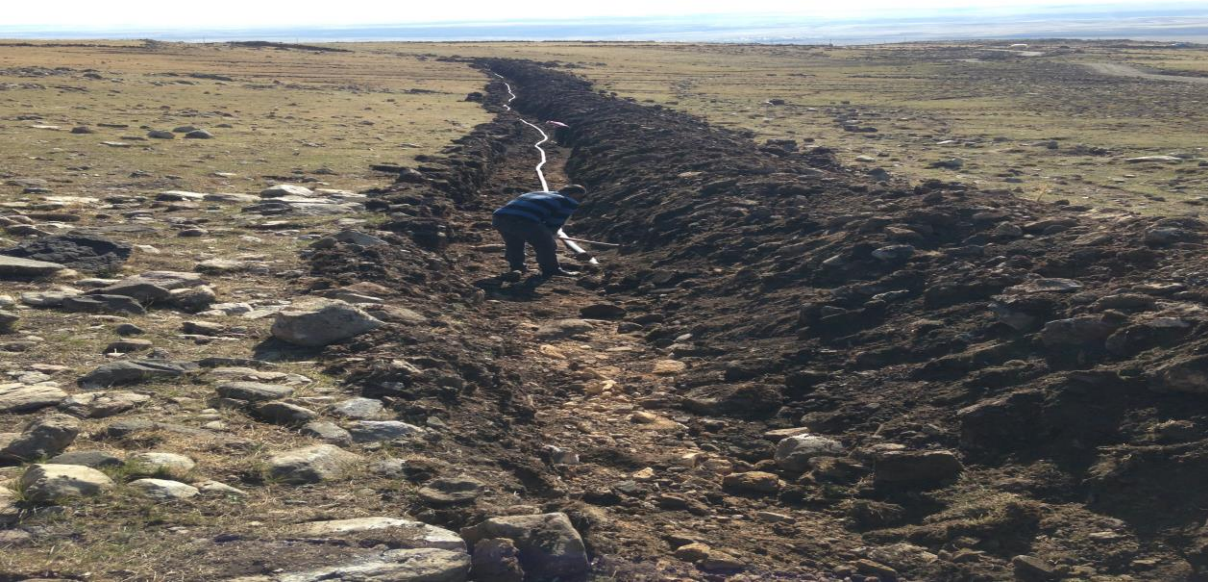
Eřmeyazı ime suyu